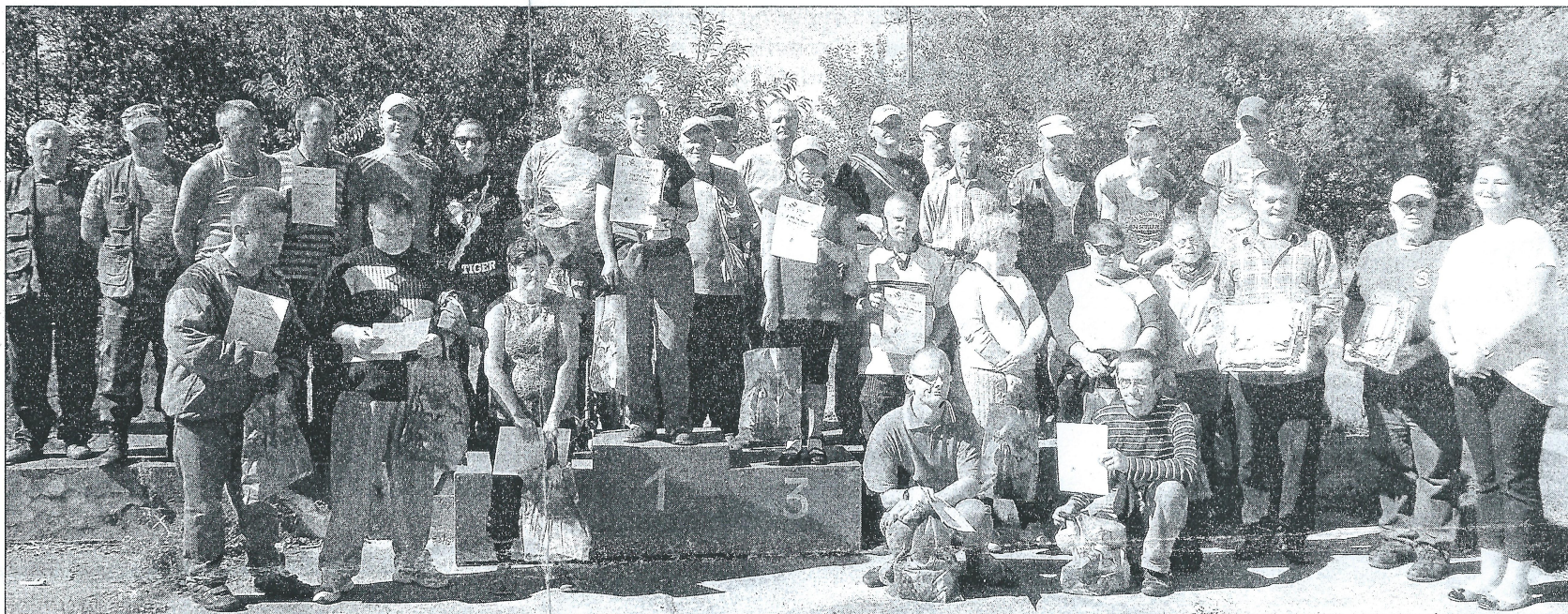
Wspólna fotografia po zakończeniu integracyjnych zawodów wędkarskich

Dla podopiecznych WTZ liczył się przede wszystkim sam start, jednak oficjalnej klasyfikacji nie mogło zabraknąć. Jak się okazało, dominowały przedstawicielki płci pięknej.