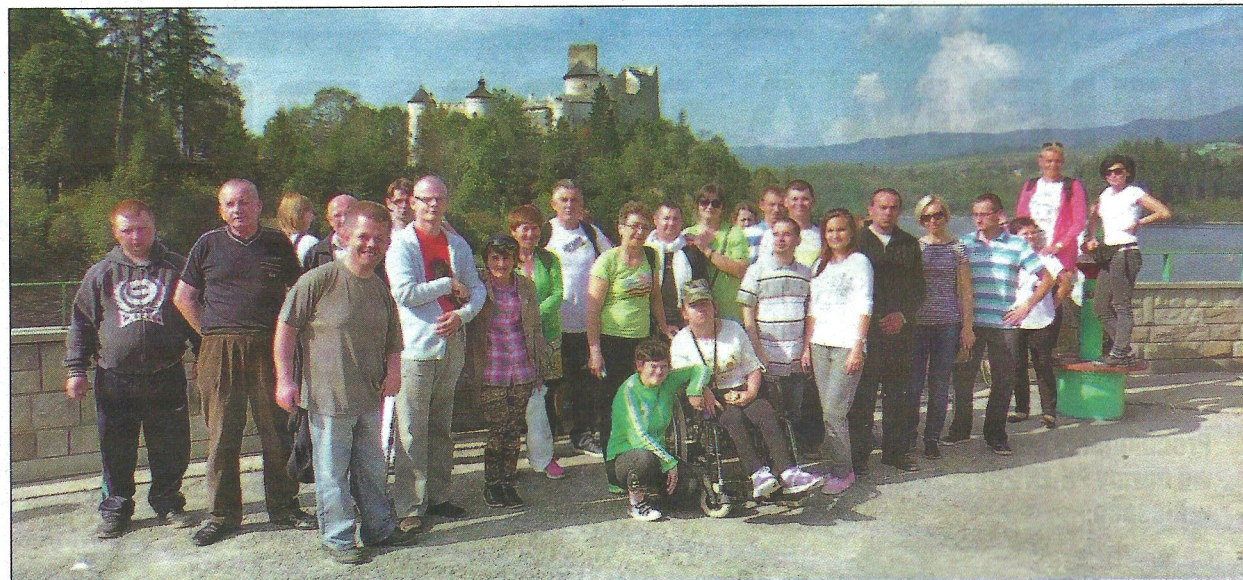
Drzewicka grupa na tle zamku w Niedzicy

Ludźmierzu. Siostra opowiedziała o historii, kulturze oraz tradycjach Podhala, Orawy i Spisza. Informacje zostały wzbogacone filmem pt. „Ludźmierz – u gaźdżiny Podhala”. Na zakończenie obejrzaliśmy sanktuarium oraz ogród różańcowy.