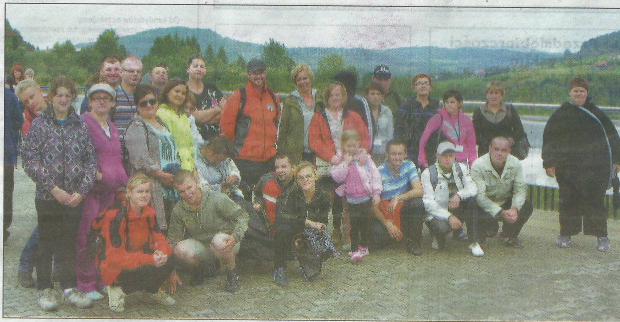
Grupa z Warsztatu Terapii Zajęciowej

W środę po śniadaniu i spotkaniu z przewodnikiem wyruszyliśmy w Bieszczady – nad małą zaporę, skąd rozpoczęliśmy zdobywać jeden z bieszczadzskich szczytów – Koziniec. Podczas wspinaczki przeżyli-